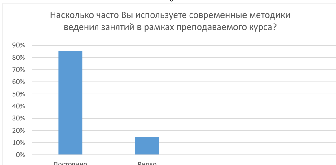
Рисунок 1 – Частота использования современных методик ведения занятий

«Насколько Вас удовлетворяет качество проводимых в Университете научных семинаров, конференций?»