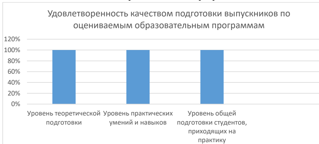
Рисунок 1 – Удовлетворенность работодателей качеством подготовки обучающихся

В целом по всем образовательным программам высшего образования на вопрос «Как бы Вы оценили качество подготовки выпускников?» ответы распределились следующим образом: 100% - «удовлетворен полностью, то есть оценивают уровень подготовки на 10 баллов по 10балльной шкале. Таким образом, 100% респондентов подтвердили, что удовлетворены качеством подготовки выпускников полностью по оцениваемым образовательным программам.