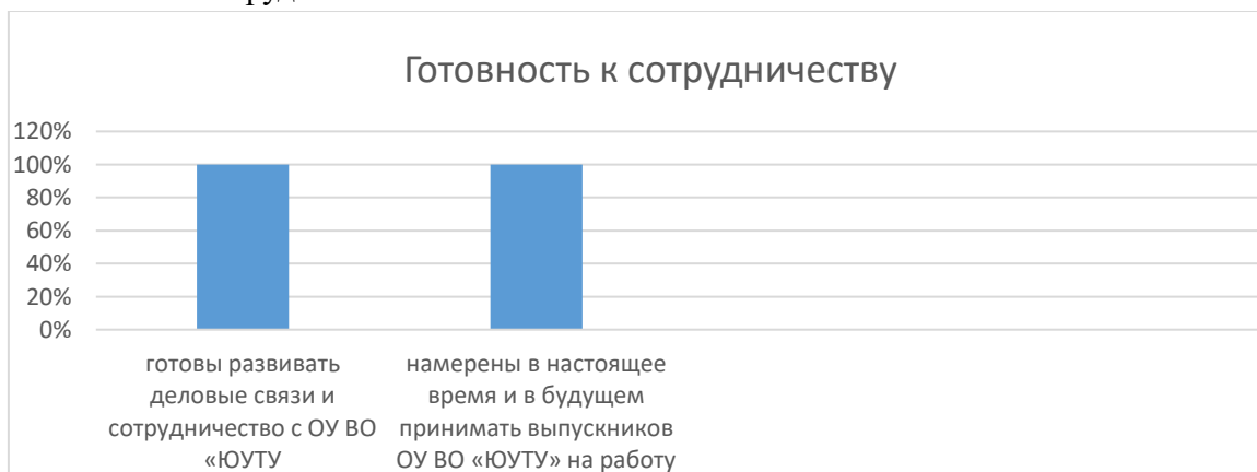
Рисунок 2 – Готовность к сотрудничеству работодателей с ОУ ВО ЮУТУ

Абсолютное большинство респондентов представителей организаций-работодателей (100%) готовы развивать деловые связи и сотрудничество с ОУ ВО «ЮУТУ».