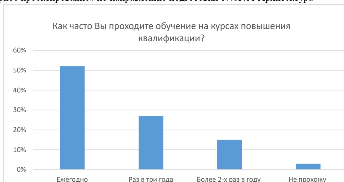
Рисунок 2 – Частота прохождения курсов повышения квалификации научно-педагогических работников по образовательной программе «Архитектурное проектирование» по направлению подготовки 07.03.01 Архитектура

На рисунке 1 продемонстрировано значение показателей по частоте прохождения курсов повышения квалификации научно-педагогических работников по образовательной программе «Архитектурное проектирование» по направлению подготовки 07.03.01 Архитектура