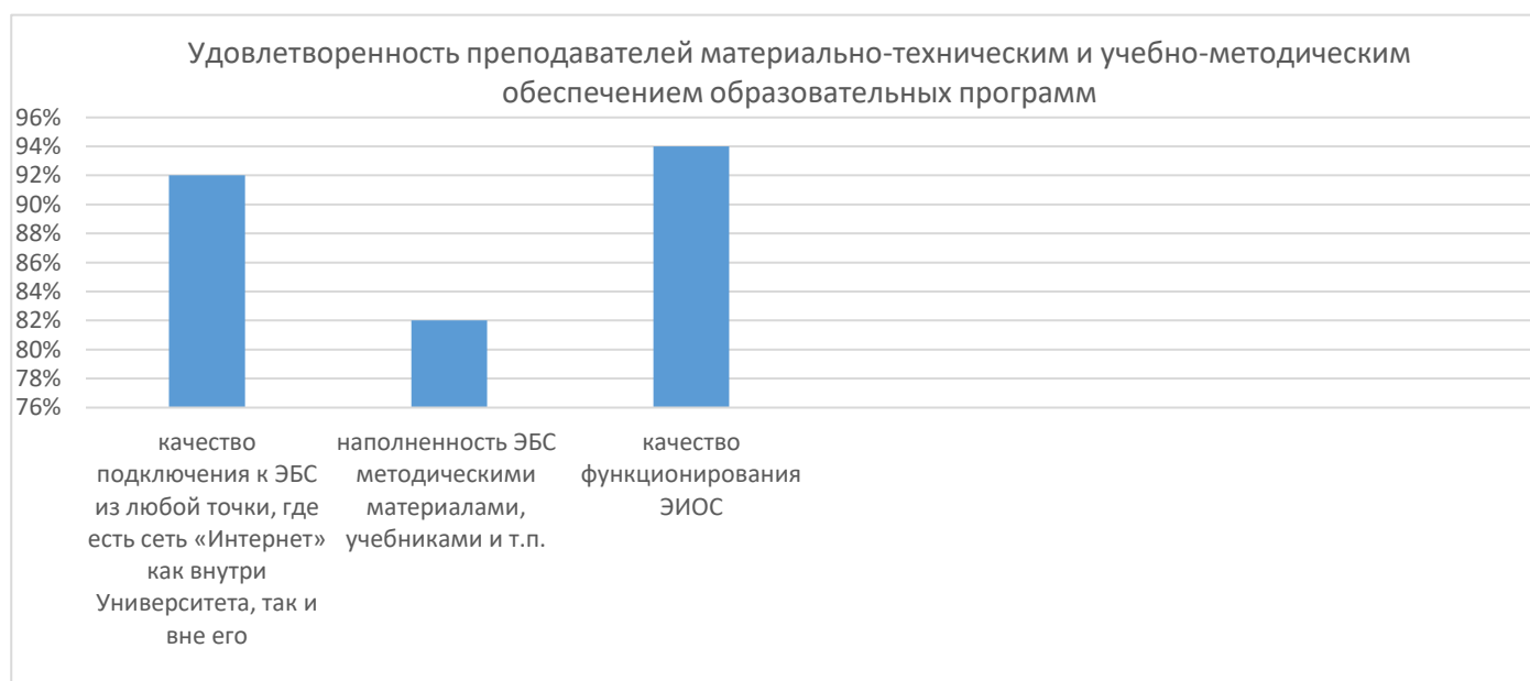
Рисунок 3 – Удовлетворенность преподавателей материально-техническим и учебно-методическим обеспечением образовательных программ

На рисунке 2 продемонстрировано среднее значение показателей по исследуемой образовательной программе и в целом по программам высшего образования по удовлетворенности преподавателей материально-техническим и учебно-методическим обеспечением образовательной программой.