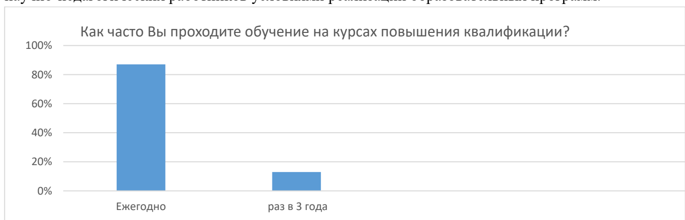
Рисунок 2 – Частота прохождения курсов повышения квалификации научно-педагогических работников образовательной программы «Землеустройство и кадастры» по направлению подготовки 21.03.02 «Землеустройство и кадастры»

На рисунке 1 продемонстрировано среднее значение показателей по исследуемой образовательной программе и в целом по программам высшего образования по удовлетворенности научно-педагогических работников условиями реализации образовательных программ.