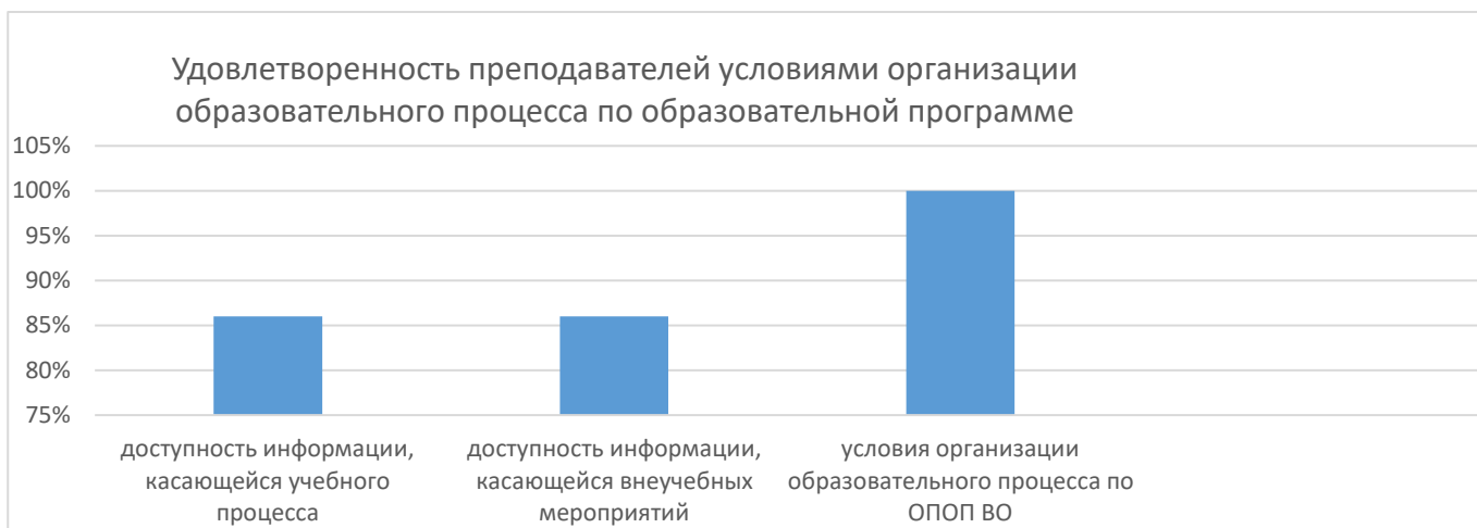
Рисунок 4 – Удовлетворенность преподавателей условиями организации образовательного процесса по образовательной программе