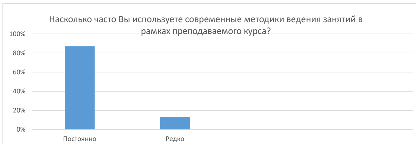
Рисунок 1 – Частота использования современных методик научно-педагогических работников образовательной программы «Землеустройство и кадастры» по направлению подготовки 21.03.02 «Землеустройство и кадастры»

«Насколько Вас удовлетворяет качество проводимых в Университете научных семинаров, конференций?»